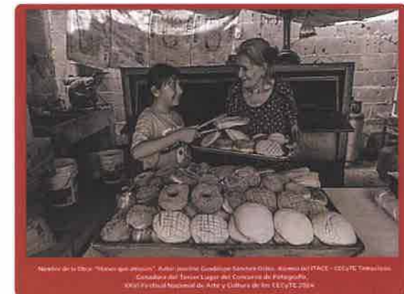
Foto de la obra "Hacer que avancen", Autor: Jessica González Sánchez Gilles, Alumno(a) ITACE - CECYTE Tamaulipas, Concurso del Tercer Lugar del Concurso de Fotografía, XVII Festival Nacional de Arte y Cultura de los CECYTE 2024